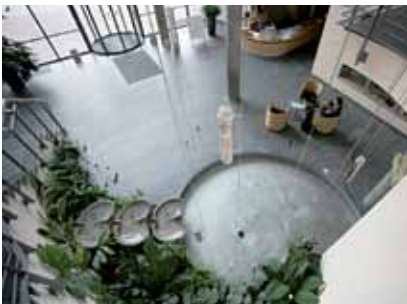
Il Foyer dell'edificio principale di WALA

Italia WALA Italia S.r.l. Via Abbadesse, 20 20124 Milano Tel.: + 39.02.29534069 Fax: + 39.02.29534066 info@wala.it www.wala.it www.drhauschka.it www.drhauschka-med.it