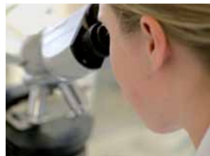
Destra: le analisi microbiologiche appartengono al repertorio standard del laboratorio analitico di controllo interno all'azienda