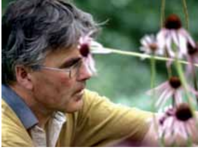
In armonia con i ritmi della Natura